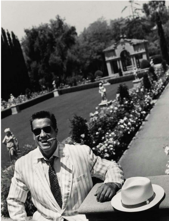
li: Kevin Costner, Los Angeles, 1988 | re: Arnold Schwarzenegger, Los Angeles, 1986

Parallel zur Porträtfotografie weist Gorman ein beachtliches OEuvre im Bereich Aktfotografie auf. Durch seinen unverkennbaren Stil mit starken Kontrasten sowie extremen Licht- und Schattenspielen konzentriert er sich auf die Grafik von Gesicht und Körper und erschafft eine klassische Ästhetik, die die zeitlose Schönheit der menschlichen Natur mit erotischer Ausstrahlung verbindet. Seine Aufnahmen von Bowies Ehefrau Iman und dem dänischen Modell Brigitte Nielsen, aber auch die tänzerischen Posen, in denen er die männlichen Starmodelle Tony Ward und Mickey Hardt inszenierte, sind legendär.