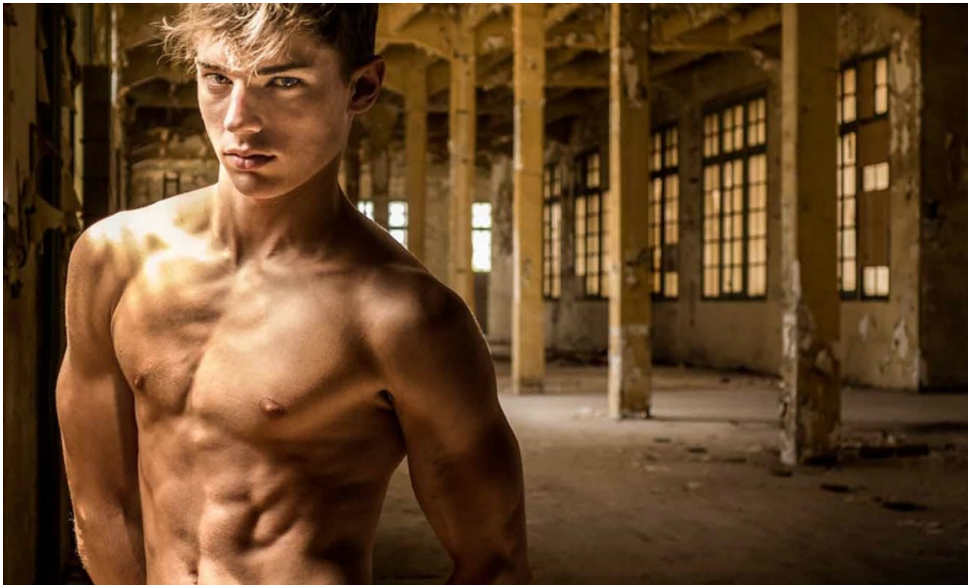
Greg Gorman. Adam Karolyi. Tarragona, Spain, 2015

Die Münchner Galerie IMMAGIS präsentiert noch bis zum 11. Mai 2019 die Fotoausstellung The Outsiders des amerikanischen Starfotografen Greg Gorman.