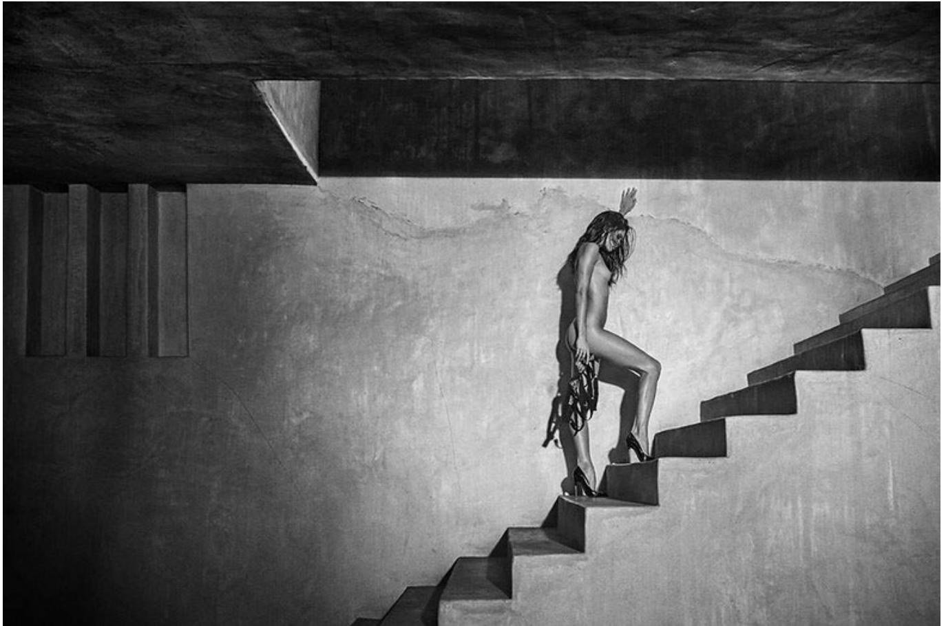
Sara, Morocco Stairs, 2016

Der Großteil der Ausstellung beinhaltet neue Werke des Künstlers, die von 2016 bis 2018 entstanden sind. Die meisten Bilder sind zum ersten Mal weltweit ausgestellt und geben Einblick in das Schaffenswerk des Künstlers und dessen Einfluss auf die gegenwärtige Akt- und Modefotografie. Dabei unterscheidet sich Russell James' Arbeitsweise und Annäherung an den Akt maßgeblich von traditionellen, sich wiederholenden Darstellungsmustern anderer Fotografen des Genres.