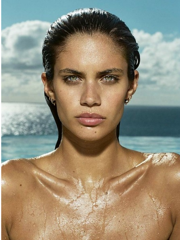
© Russell James, Sara, Blue Portrait, 2016, courtesy CAMERA WORK

Russell James (*1962 in Perth) zählt zu den weltweit führenden Mode- und Aktfotografen.